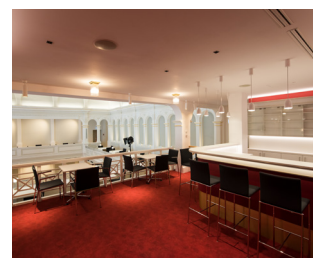
Bar-Bereich auf dem Rang