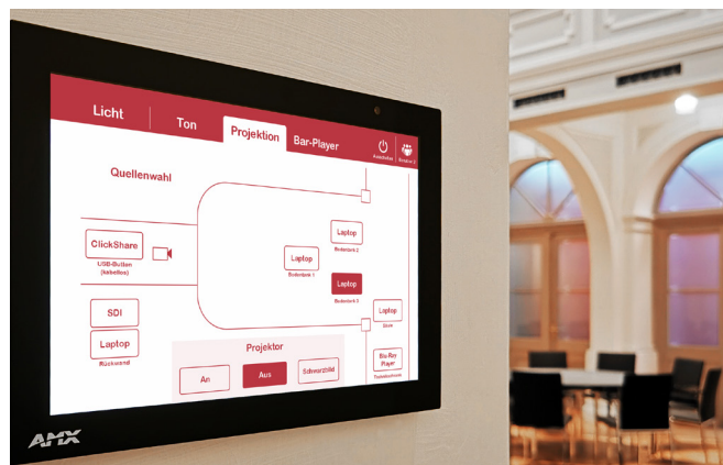
Touchpanel zur Steuerung der Medientechnik

Mit Hilfe zweier integrierter Touchpanels sind Beleuchtung, Beamer, Leinwand, Stromzufuhr sowohl vom Parkett als auch vom Rang aus mittels Finger-Touch steuerbar. Zudem steht ein mobiles iPad mit der gleichen, von VST programmierten Funktionalität zur Verfügung