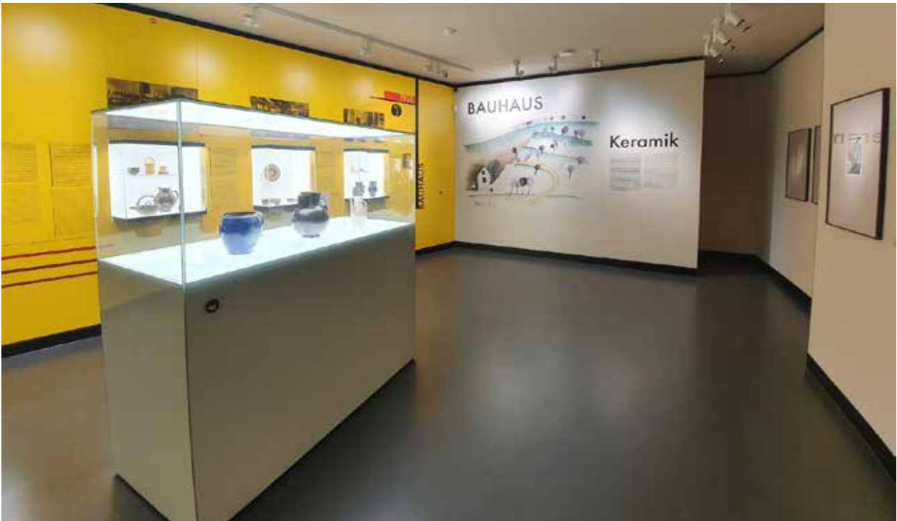
Zentral-Vitrine mit NFC-Chip